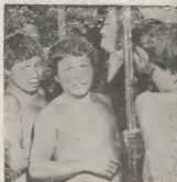
E fotoonan rober ta muestra algun Indígena Mexicano mastrando e presidente Colombiano Leon Valencia (den centro) e palosan pa coge pisa cu nan te nan den nan parló. Un pafoar a trece 4 di e Indígenan aki Bogota. Ta biza e intencion pa nan heda 3 lina, pero e.a mester a regresá ora cu nan heje a trahé di trata 3 huesped México.

E detencion aki a pone e gobierno di Cuba demanda e gobierno mericano entrega di e tripulantenan y si esaki no socede, anto e gobierno cubano lo no entrega awa mas na e base naval mericano situa na Guantanamo. Dinsabra azochi e gobierno di Castro a stop di entrega awa na e base aki. E gobierno di Estados Unidos rapidamente a manda dos funcionario bai delibera cu e gobierno cubano tocante di e decisión drastico aki.